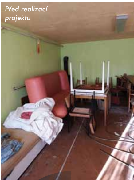
Před realizací projektu

Máme za sebou úspěšně zrealizovaný projekt Obnova sportovišť v Regionu Kunětické hory z roku 2018, v rámci kterého bylo podpořeno pět obcí, projekt Obnova sportovišť v MAS Region Kunětické hory II. z roku 2019, kterého se účastnily čtyři obce, a tak jsme se s chutí pustili v rámci Programu obnovy venkova vyhlášeného Pardubickým krajem do projektu Obnova sportovišť a dětských hřišť v MAS Region Kunětické hory. Zájem byl tak veliký, že jsme museli kvůli omezeným finančním prostředkům vyřadit některé uchazeče, ale i tak