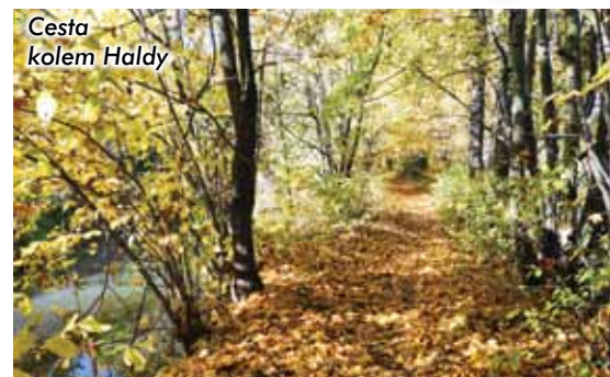
Cesta kolem Haldy

Halda je uměle vytvořený tok o délce 10 kilometrů ještě z dob Pernštejnů. Začíná nedaleko Počapel, vytéká z Loučné a ústí do Labe za zdymadlem v Pardubicích. A čím je tento kanál tak zajímavý? Jednak je okolo něj krásná procházka vedoucí po červené turistické