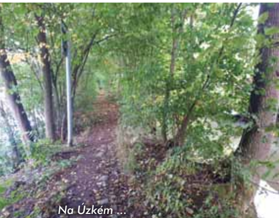
Na Úzkém ...

značce, zdatnější cyklisté s horskými koly se mohou okolo něj i projet, a jednak je to technický unikát, na jehož toku naleznete mnoho zajímavostí.