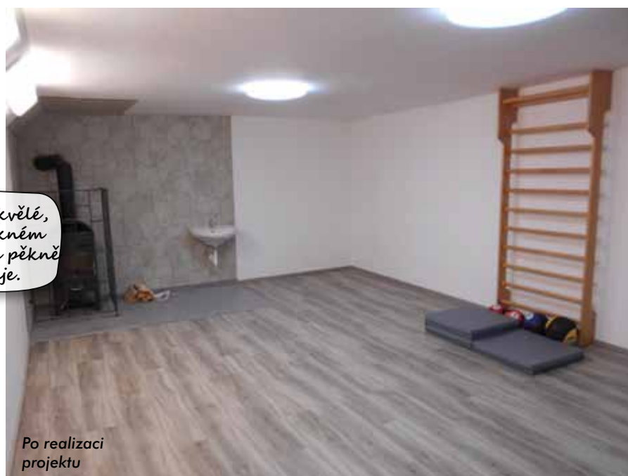
Po realizaci projektu

Aktivně podporovat společenský život v obcích a regionu