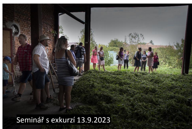
Seminář s exkurzí 13.9.2023