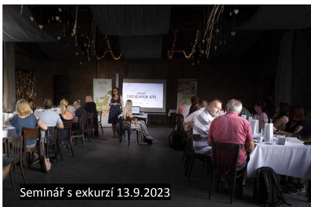
Seminář s exkurzí 13.9.2023