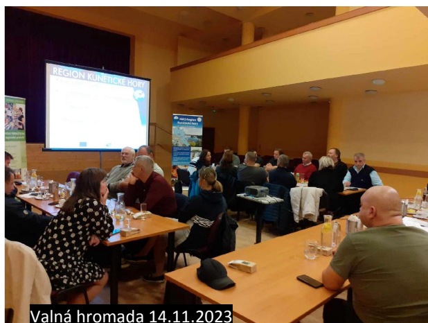
Valná hromada 14.11.2023