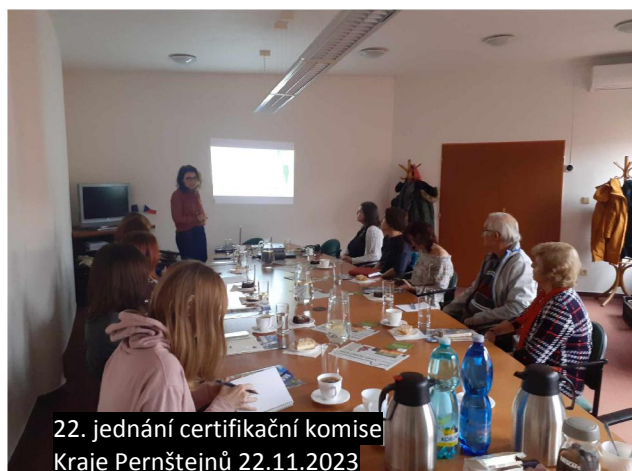
22. jednání certifikační komise Kraje Pernštejnů 22.11.2023