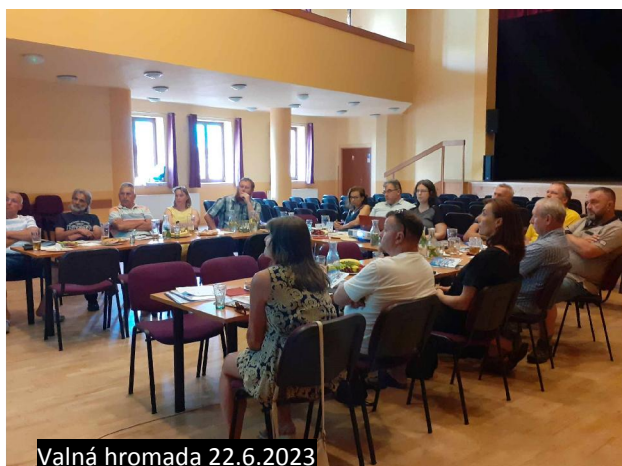
Valná hromada 22.6.2023